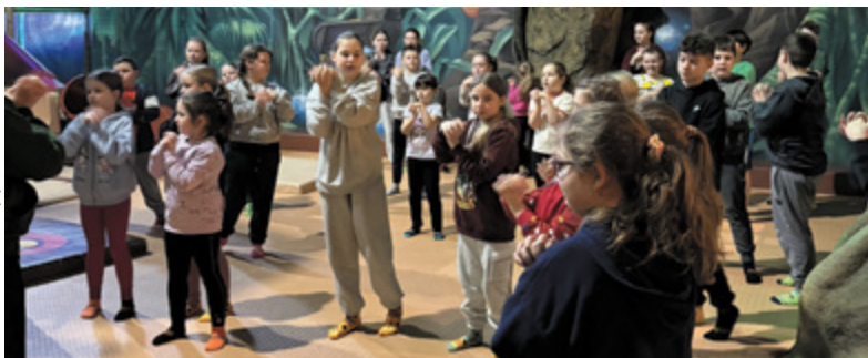
^ Jungle Park w Rzeszowie