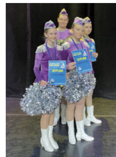
^ Mażoretki „Dżet” z Gminnego Ośrodka Kultury w Niebylcu