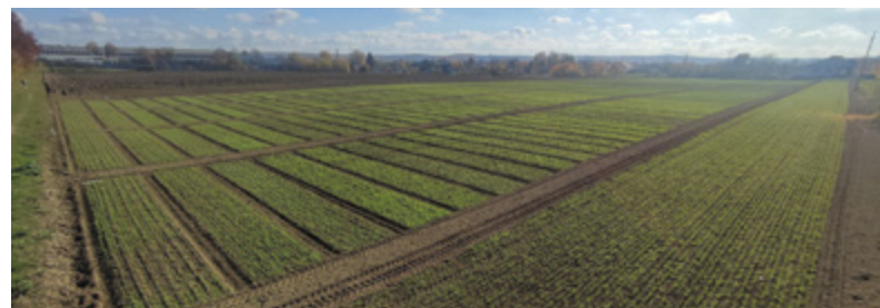
▲ Pole doświadczalne Podkarpackiego Ośrodka Doradztwa Rolniczego w Boguchwale