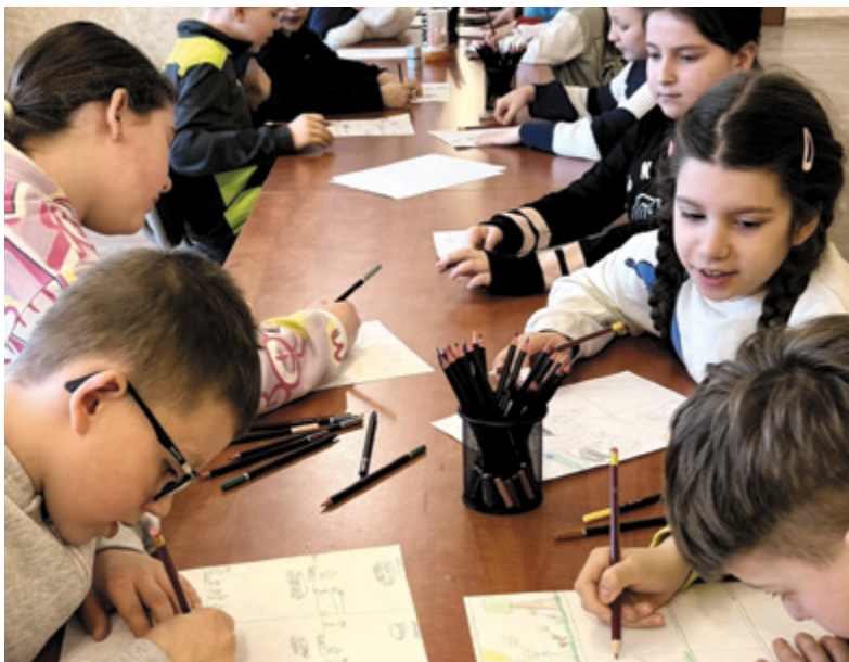
^ Warsztaty z tworzenia komiksów

Pierwszy dzień ferii, 16 lutego, rozpoczął się wyjątkowo warsztatami pt. „Niezwykłe życie motyli”. Podczas spotkania dzieci poznały fascynujący świat tych pięknych owadów. Dowiedziały się, jak wygląda cykl życia motyla od jajka, przez gąsienicę i poczwarkę, aż po dorosłego motyla. Uczestnicy poznali także miejsca, w których można spotkać motyle oraz zasady właściwego obchodzenia się z nimi. Dużą atrakcją było oglądanie motyli z różnych stron świata oraz możliwość spotkania z żywymi motylami, które latały wokół uczestników. Każde dziecko mogło potrzymać motyla na dłoni. Na zakończenie wszyscy otrzymali pamiątkowe dyplomy oraz przypinki w kształcie motyla.