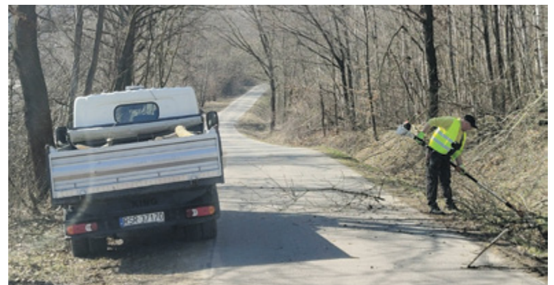
^ Prace porządkowe