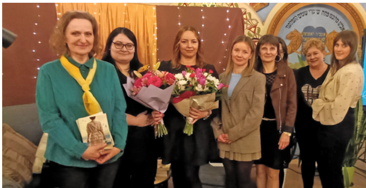
^ Kadra biblioteki z autorką