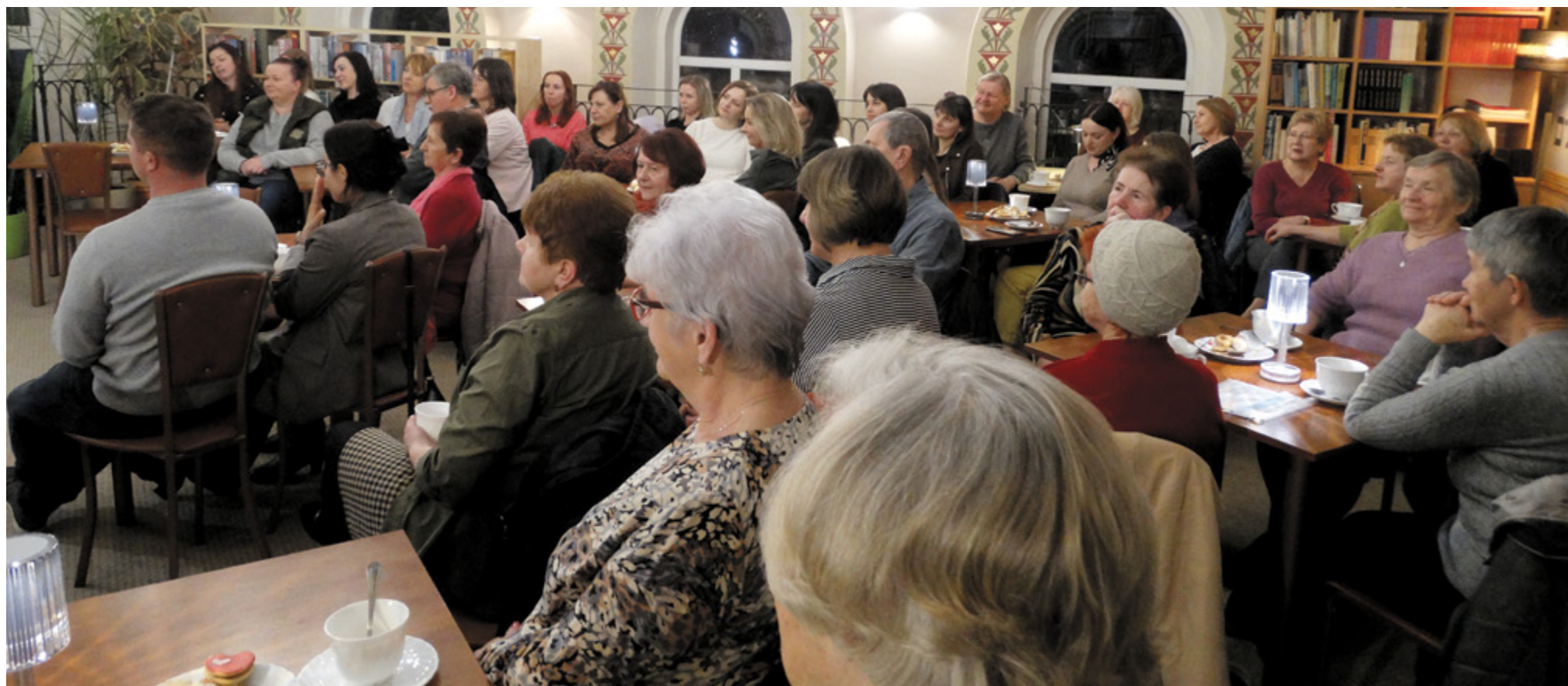
^ Uczestnicy spotkania