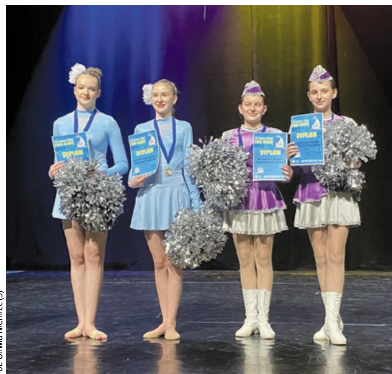
Fot. Oliwia Niemiec (3)