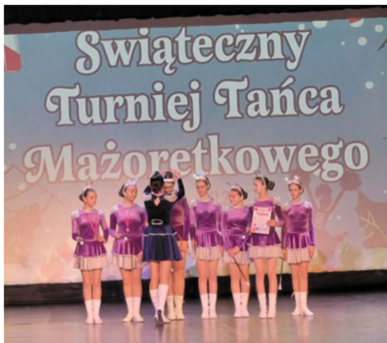
^ Mażoretki „Dzet” – juniorki