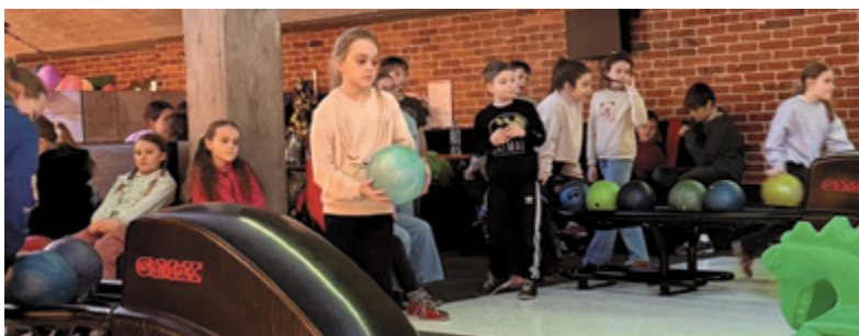
^ Kręgielnia w Dobrzechowie